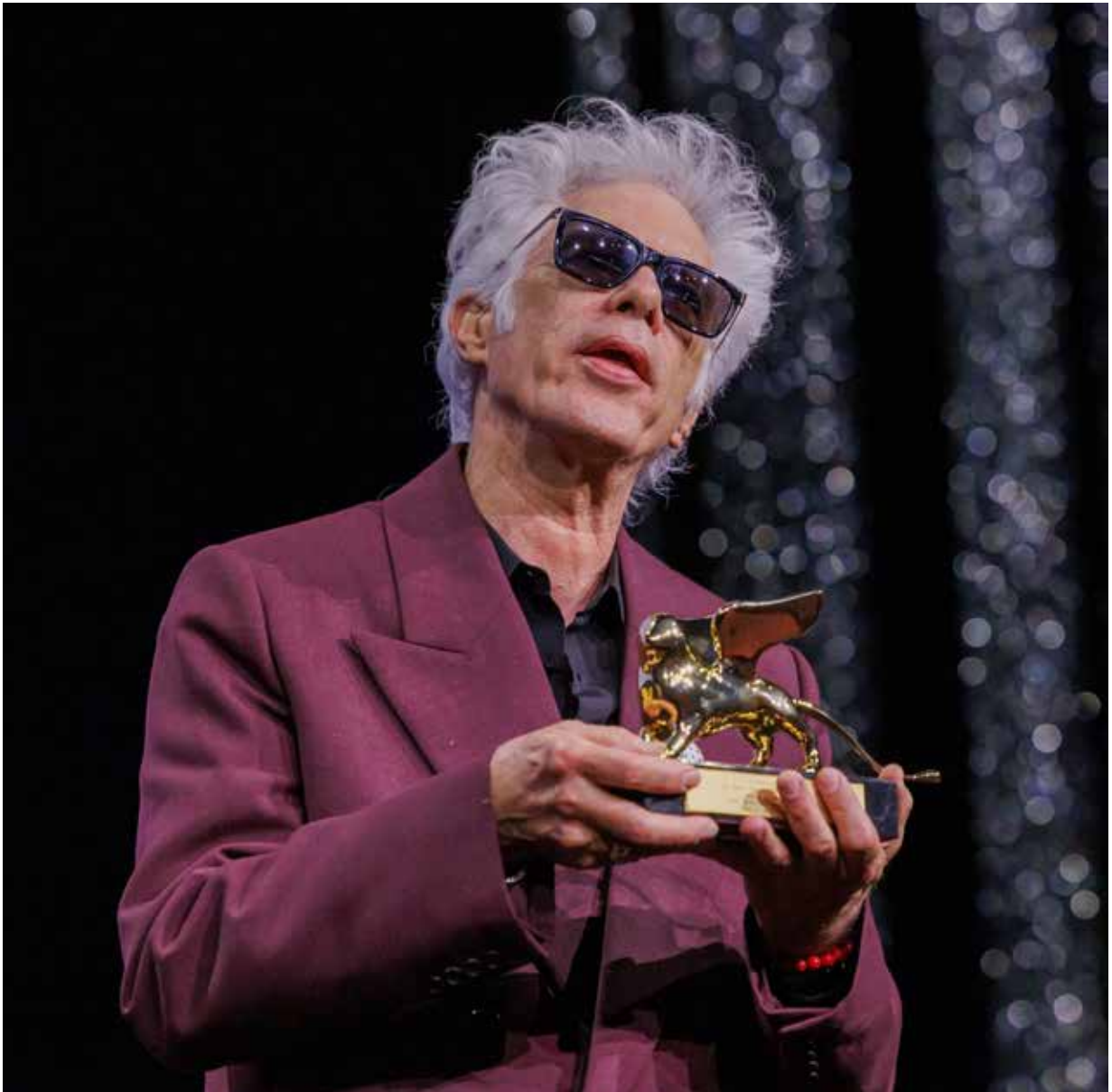
Jim Jarmusch gana el León de Oro en el Festival de Venecia 2025