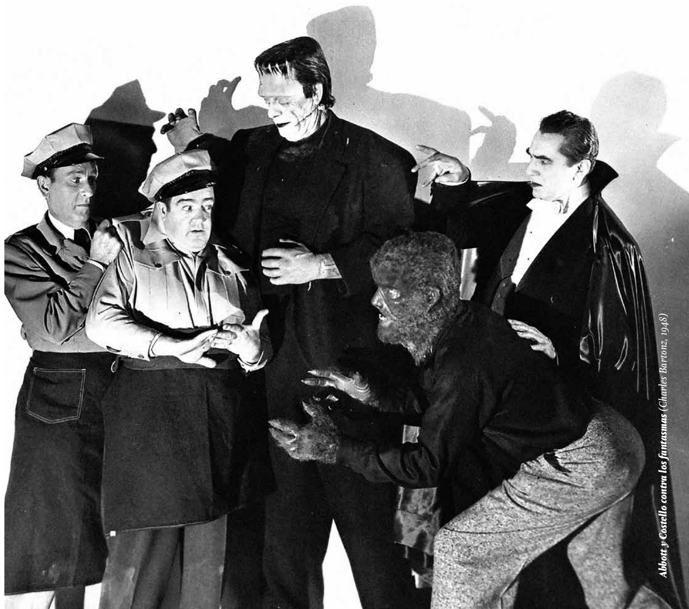
Abbott y Costello contra los fantasmas (Charles Barton, 1948)

La serie de Monstruos Clásicos de la Universal (cuyas obras cumbres entre 1925 y 1956 sobre Drácula, el monstruo de Frankenstein, el monstruo de la Laguna Negra y el Hombre Invisible, entre otros, ya hemos revisado años anteriores) fue precursora en muchos aspectos de las franquicias cinematográficas a las que estamos acostumbrados en el presente. Con el cruce en 1943 entre el monstruo de Frankenstein y el hombre lobo, se inauguró casi en broma una idea muy cercana a la del "multiverso", en el que personajes de distintas procedencias se cruzaban en un mundo común. A través de Larry Talbot y las míticas interpretaciones de Lon Chaney Jr., en este ciclo exploraremos ese territorio en que todos estos seres terroríficos podían convivir (y de hecho lo hacían) a la vez.