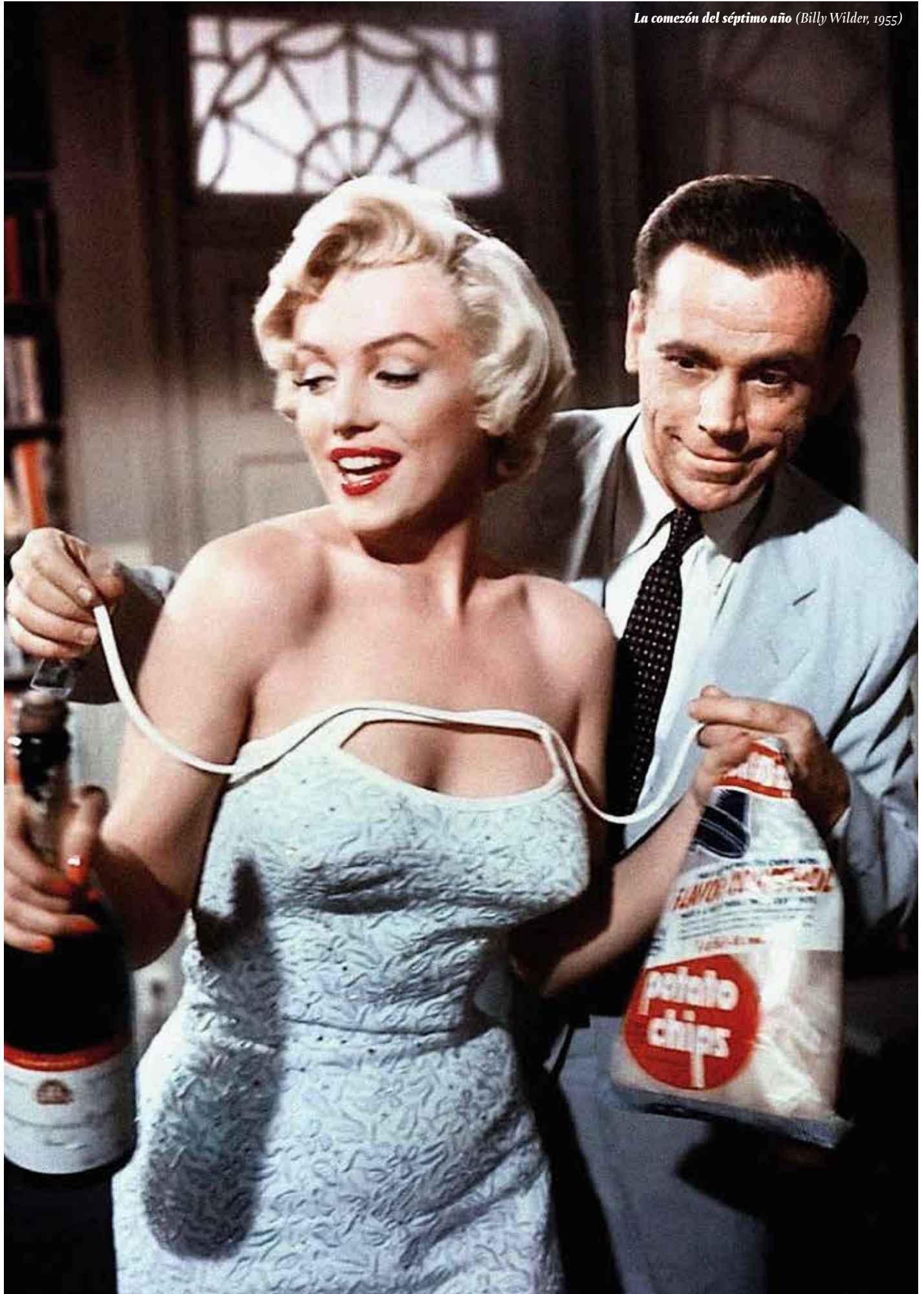
La comedia del séptimo año (Billy Wilder, 1955)