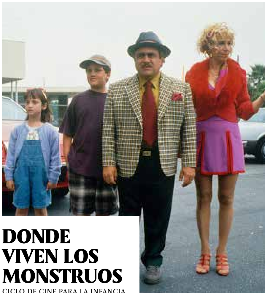
Matilda (Danny Devito, 1996)

Tras la muerte de sus padres, el pequeño James se ve obligado a vivir con sus dos crueles y repulsivas tías. La visita de un extraño personaje, una araña a la que salva, le proporciona el medio para escapar: un durazno gigante que comienza a crecer desmesuradamente en su jardín. Cuando se introduzca dentro de él conocerá a otros pintorescos personajes.