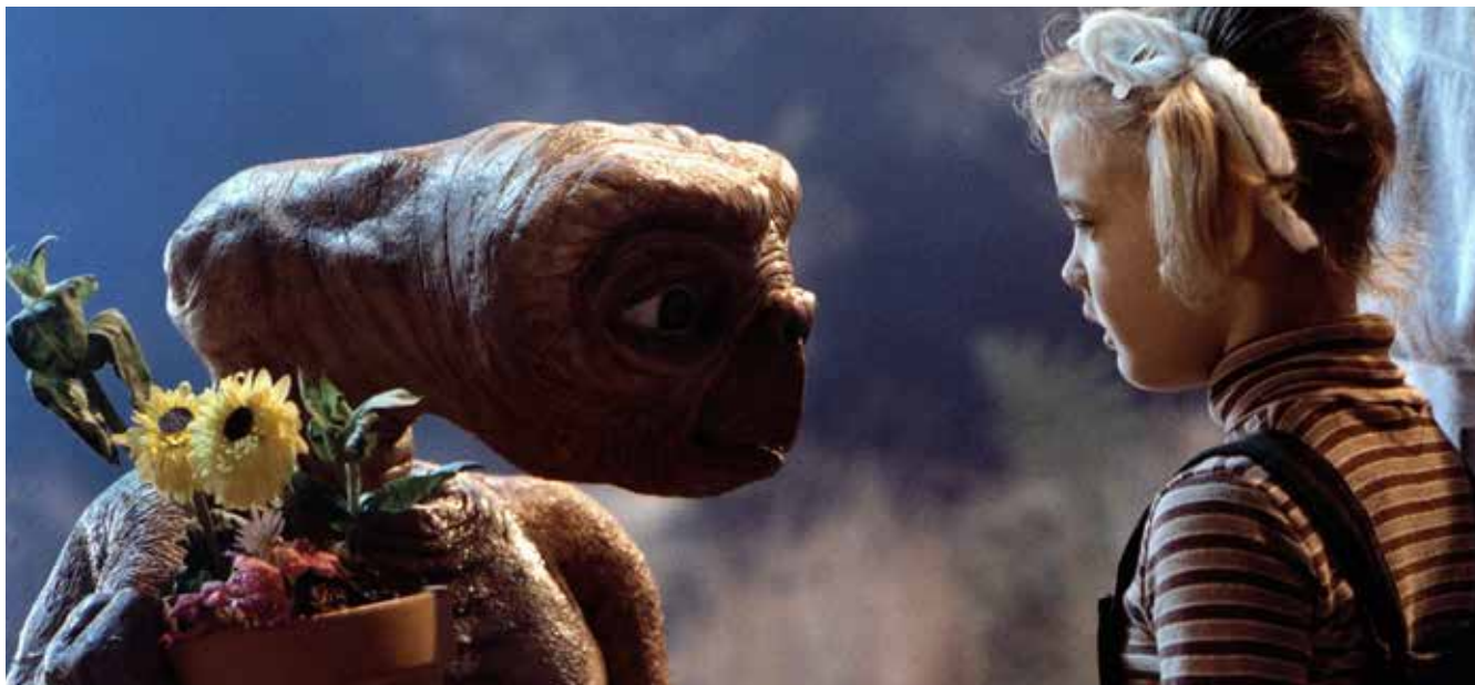
E.T., el extraterrestre (Steven Spielberg, 1982)