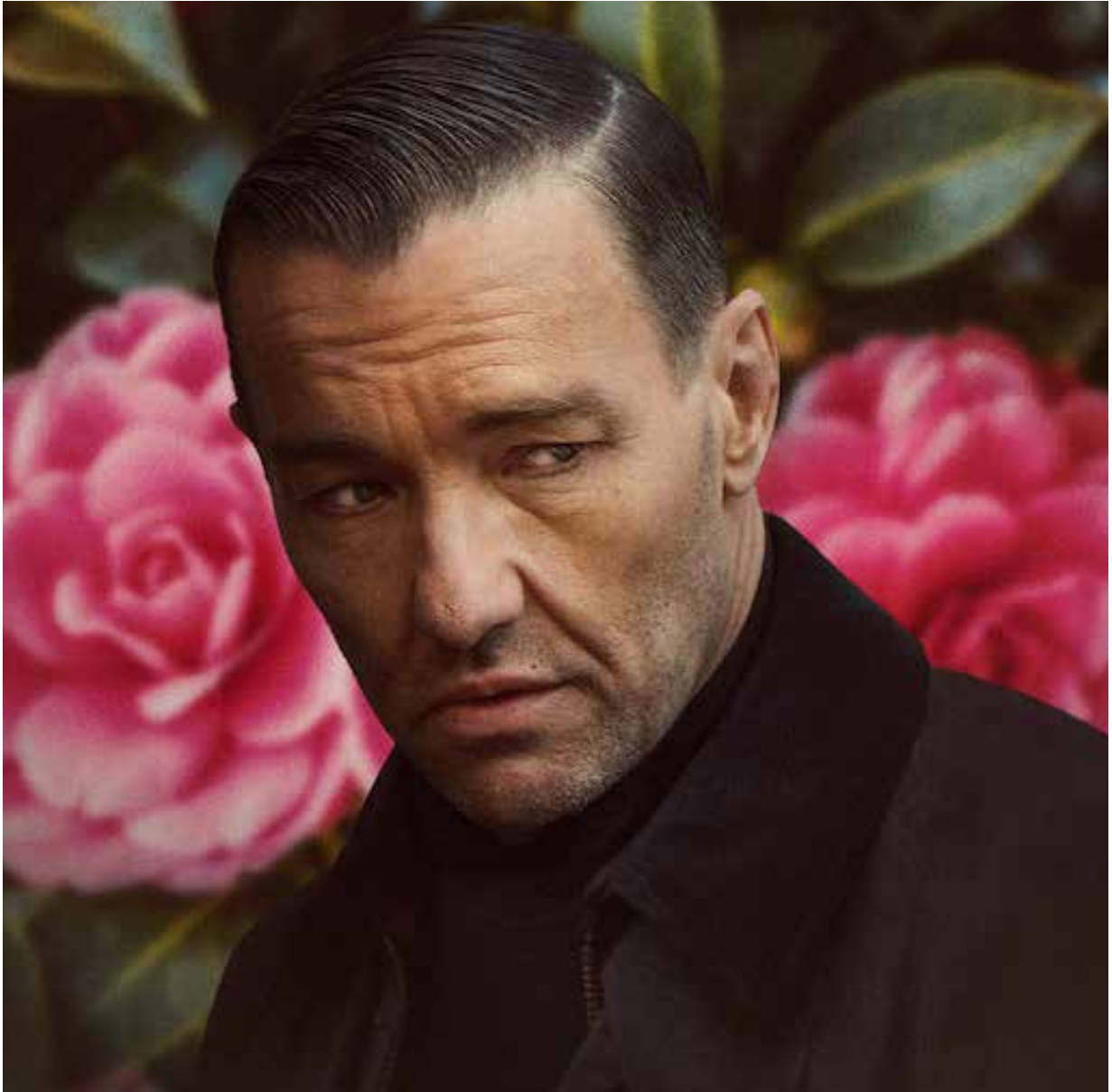
El jardín del deseo (Paul Schrader, 2022)

“El verdadero jardinero se descubre frente al pensamiento salvaje” (Jacques Prévert)