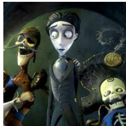
El cadáver de la novia (Tim Burton, 2005)