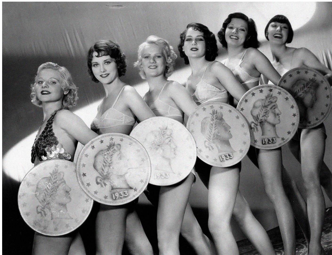
Vampiresas 1933 (Mervyn Leroy, 1933)