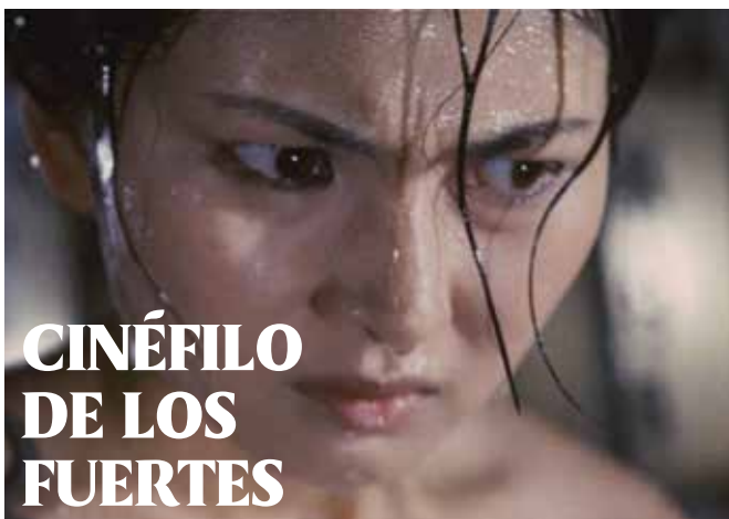
La maldición de la mujer ciega (Teruo Ishii, 1970)