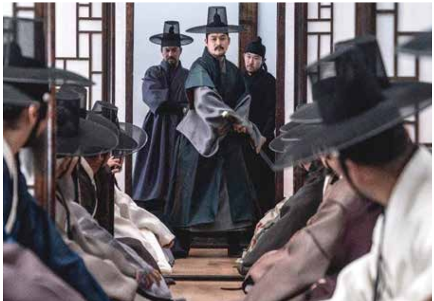
Fengshui (Park Hee-Kon, 2018)

de un programa de audiciones de televisión durante seis años, pero nunca logró llegar a la final. El día en el cual falla por séptima vez recibe una llamada de su ciudad natal: su padre se encuentra en el hospital. De apuro viaja a Byeonsan, el lugar que dejó desde que abandonó la escuela, pero al llegar descubre que solo se trató de un complot.